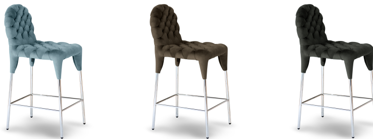
(左からベルベット：ブルーグレイ、エスプレッソブラウン、レザー：ブラック)

集シリーズとあわせて、ベルベットとレザーの2種類の生地からお選びいただけます。ベルベットは細かな起毛で光沢が美しく、夏は爽やか冬は暖かな肌触りを楽しめます。レザーは集ソファと同じイタリア製のレザーを贅沢に採用しました。しっとりとした豊かな質感をツールでもお楽しみいただけます。