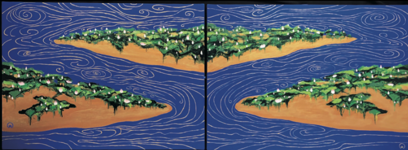
「縁起」 Fukuoka Wall Art Project 入賞作品