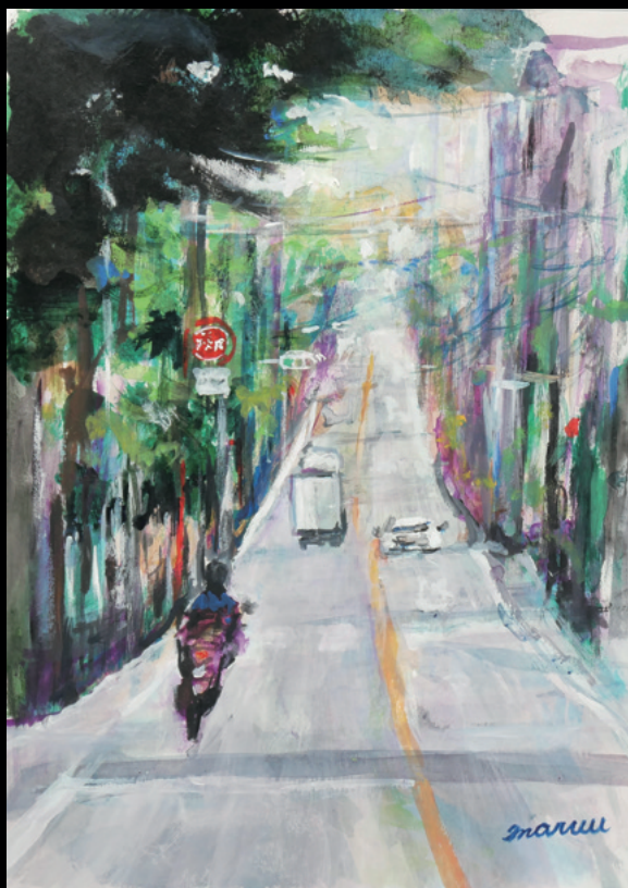
浄水通りシリーズより